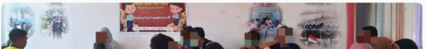
Layanan Kunjungan Tatap Muka Lebaran

KUTOARJO - Layanan Kunjungan khusus hari raya Idul Fitri 1444 H memasuki hari ke-4 atau terakhir, terlihat para pengunjung masih cukup ramai. Berdasarkan data petugas ruang layanan kunjungan, Theo Yulius pada sesi pertama pukul 08.00 WIB sampai dengan 11.15 WIB tercatat 40 pengunjung terdiri atas pengunjung dewasa 31 orang dan 9 pengikut anak, Selasa (25/4/2023). Selain itu, layanan kunjungan online family link berupa video call dengan sarana 3 komputer PC juga tampak ramai, tercatat mencapai 60-an Anak yang menggunakannya dengan didampingi petugas pada sesi pertama. Kepala LPKA Klas 1 Kutoarjo, Teguh Suroso mengatakan layanan kunjungan online dibuka sama dengan kunjungan tatap muka agar Anak Binaan yang tidak bisa dibezuk karena kendala ekonomi, jarak yang jauh, macet suasana lebaran dan lain sebagainya bisa terobati rindu kepada keluarga sekaligus bersilaturahmi